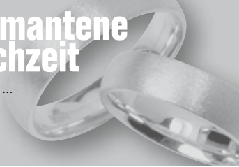
Ingeborg und Ewald Prameshuber