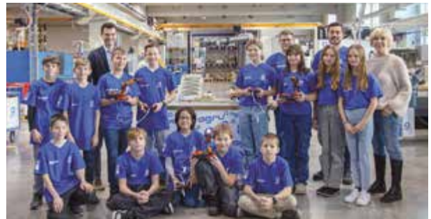
Die moderne Lehrwerkstatt der AGRU Kunststofftechnik bildete eine beeindruckende Kulisse für die praktische Anwendung von Robotik und Automatisierungstechnologien.

Das Projekt „Werken in der Industrie“ gibt den Teilnehmern nicht nur Einblicke in technische Abläufe und Produktionsprozesse, sondern auch in die vielfältigen beruflichen Möglichkeiten, die die Kunststofftechnik bietet. „Unser Ziel ist es, junge Menschen für die Technik zu begeistern und ihnen praktische Fähigkeiten zu vermitteln, die in der modernen Ar-