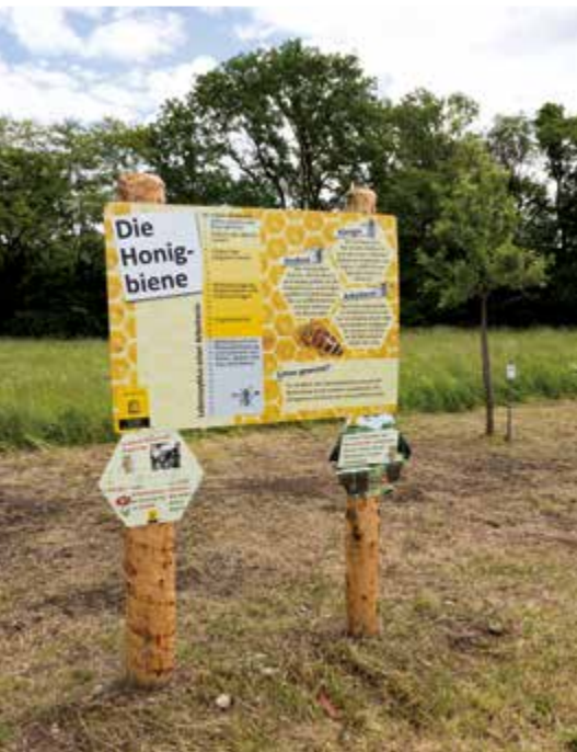
▲ Eine der neun Schautafeln für Erwachsene.