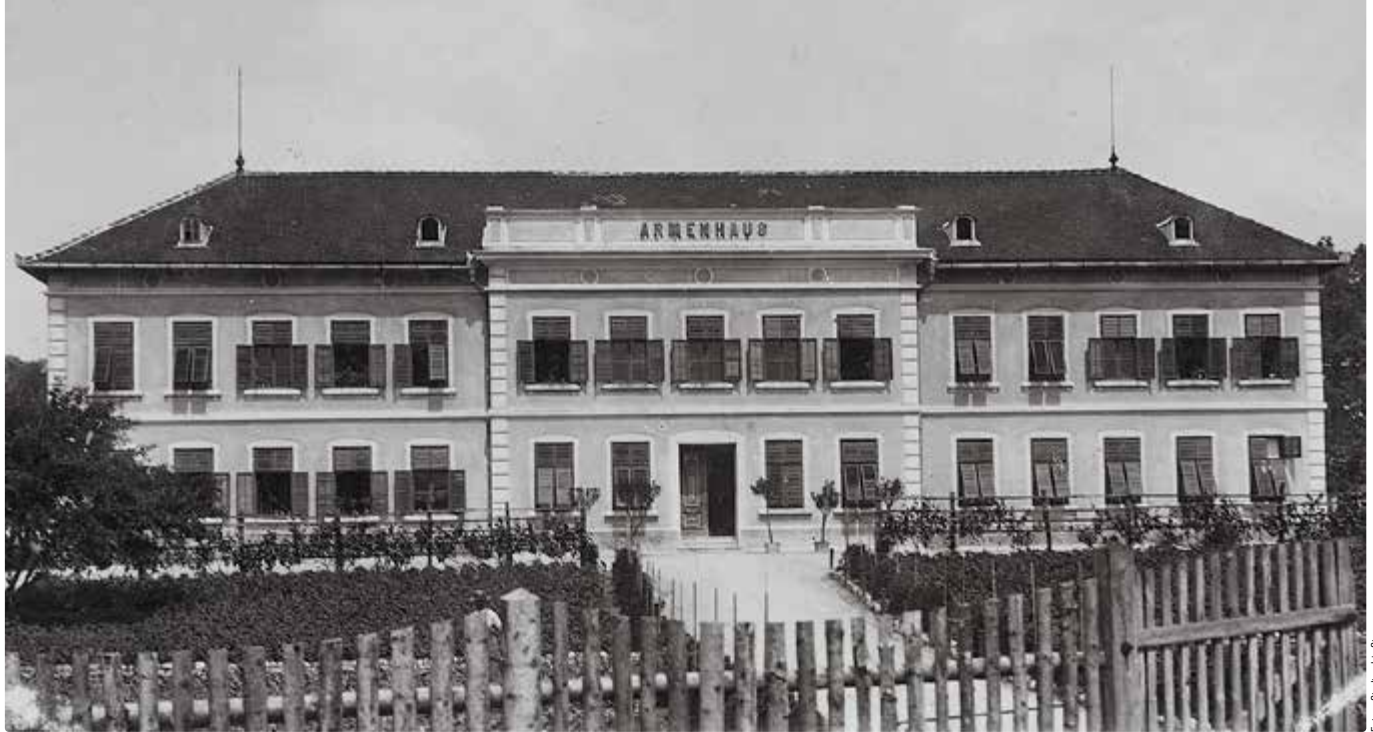
▲ Das 1882 fertiggestellte Armenhaus an der Sierninger Straße konnte mithilfe der großzügigen Spende von Elise Dukart errichtet werden.

brave, treue und fleißige Dienstbottinnen ausbezahlt werden. Sollten sich keine fünf weiblichen Dienstbotten darum bewerben, so kamen auch männliche in Frage. Bedingung war, dass sie mindestens 15 Jahre im selben Haushalt tätig waren und sich dort durch sittliches Betragen ausgezeichnet hatten. Armut, Alter und Krankheit wurden ebenfalls berücksichtigt.